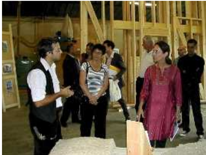
Ségolène Royal dans l'atelier de charpente et d'éco-construction d'Eddy Fruchard.

Fruchard, le garage, le salon de coiffure, le multiservices de proximité et le tout nouveau stade furent les étapes successives parcourues. C'est d'ailleurs au club-house du stade que Ségolène Royal, avec Jean-Charles Pied à ses côtés, a partagé une longue discussion avec les maires du canton présents à une très grande majorité. Les réalisations et les projets de chacun purent être évoqués. Ségolène Royal a insisté pour que « les projets ne soient pas entravés par des freins administratifs » et que « les actions dynamiques et créatrices d'emplois puissent trouver leurs financements ».